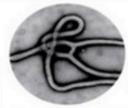
Fiebre hemorrágica del virus de Ébola (EHF)